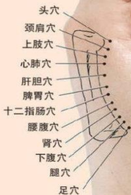
手的第二掌骨全息穴位图